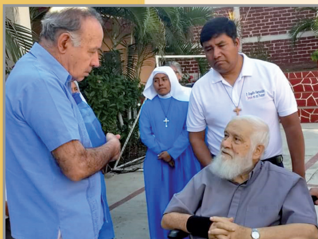
El Arzobispo de Acapulco, Mons. Leopoldo González visitando la Casa del Apóstol este 16 de diciembre de 2017.

Así pues, hoy hemos querido traerles una breve guía para ir a adorar al Santísimo. Te recomendamos que lleves contigo la Biblia o consigas un devocionario o algún libro espiritual de un santo.