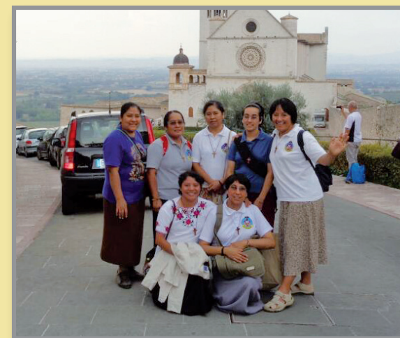
La comunidad de Apóstoles de la Palabra que realiza misión en Italia.

hacer la promesa por cierto tiempo, el Mago. Lo llamaban así porque se dedicaba a dar funciones de prestidigitación en las escuelas. Lo siguieron distintos jóvenes. Un año después eran ya dieciocho. La plantita se estaba haciendo árbol frondoso.