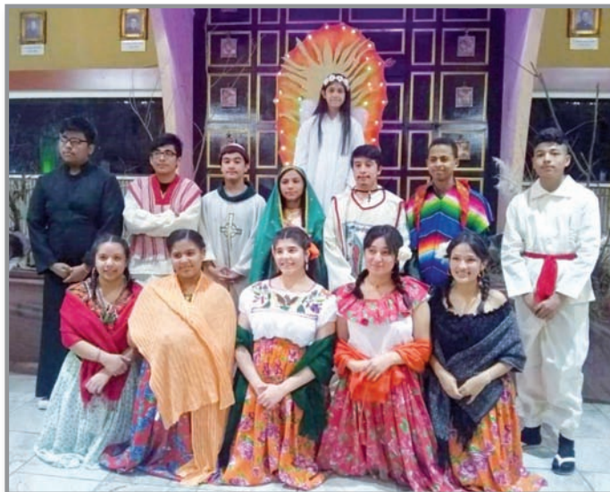
Los integrantes de Jumap Atlanta presentaron las apariciones de Nuestra Señora de Guadalupe en la parroquia de San Patricio, en Norcross, Georgia, este 12 de diciembre de 2017.

Y concluyen el documento con una llamada general a todos los fieles: "no caigáis en la apostasía" (la negación de la fe cristiana) a causa de la multiplicidad de grupos religiosos. Al contrario, debéis testimoniar, en vuestros ambientes de vida, vuestra fe en Jesucristo muerto y resucitado".