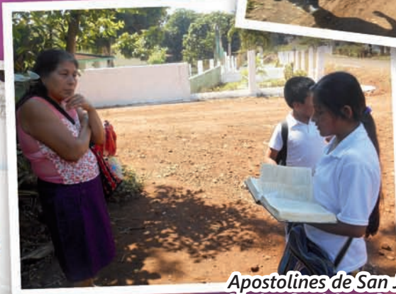
Apostolines de San Juan Seco haciendo visitas domiciliarias en la comunidad de Candelaria, Ver.