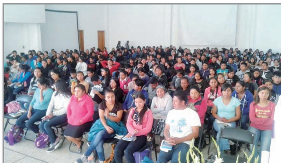
Congreso juvenil realizado el sábado 2 de diciembre de 2017 en la Arquidiócesis de Oaxaca por parte del Movimiento Eclesial "Apóstoles de la Palabra".

Ya no eres seminarista pero sigues siendo cristiano. Sigue trabajando en tu formación humana, espiritual y académica pues si bien, no estarás al frente de una parroquia seguirás trabajando dentro de la Iglesia como laico. Vive una vida sacramental intensa y de oración pues no solo el sacerdote necesita de ello sino todos nosotros por nuestra naturaleza frágil.