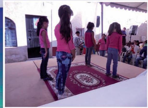
Apostolinas presentando un baile en la fiesta de los santos que organizaron las hermanas misioneras de Tonalá.