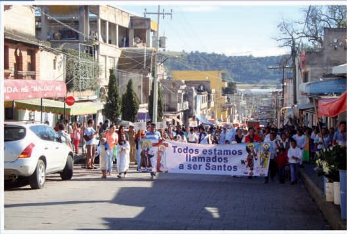
Los niños del catecismo con sus papás, en la fiesta de los santos en Xalatlaco, organizada por los Promotores y Defensores de la Fe.